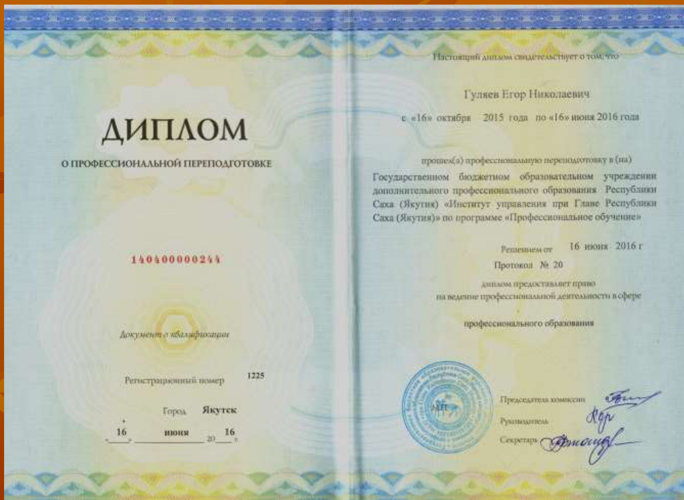
Диплом о профессиональной переподготовке ГБОУ ДПО РС(Я) «Институт управления при Главе РС(Я)» по программе «Профессиональное обучение», 360 часов, 2016