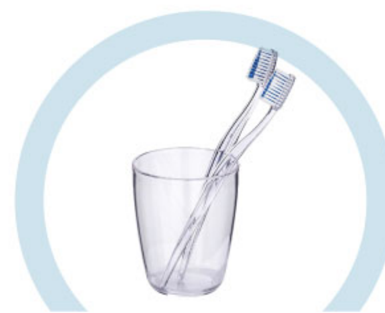
ТУАЛЕТНЫЕ ПРИНАДЛЕЖНОСТИ (ЗУБНЫЕ ЩЕТКИ, РАСЧЕСКИ И ПР.)