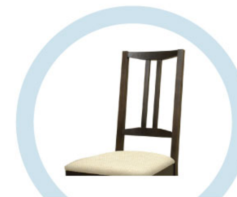
СПИНКИ СТУЛЬЕВ, НЕ ОБИТЫЕ ТКАНЬЮ И МЯГКИМ ПОРИСТЫМ МАТЕРИАЛОМ