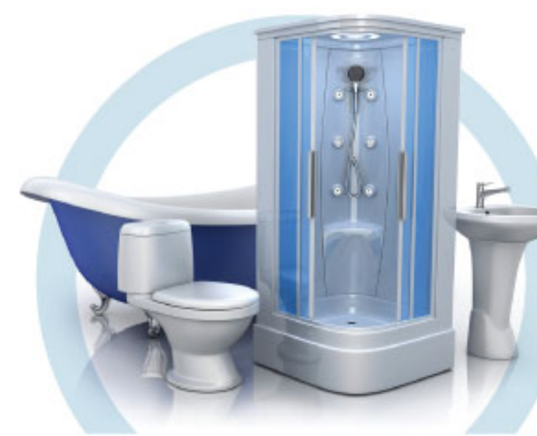
ТУАЛЕТ (УНИТАЗ, ВАННА, ДУШЕВАЯ КАБИНА, БИДЕ)