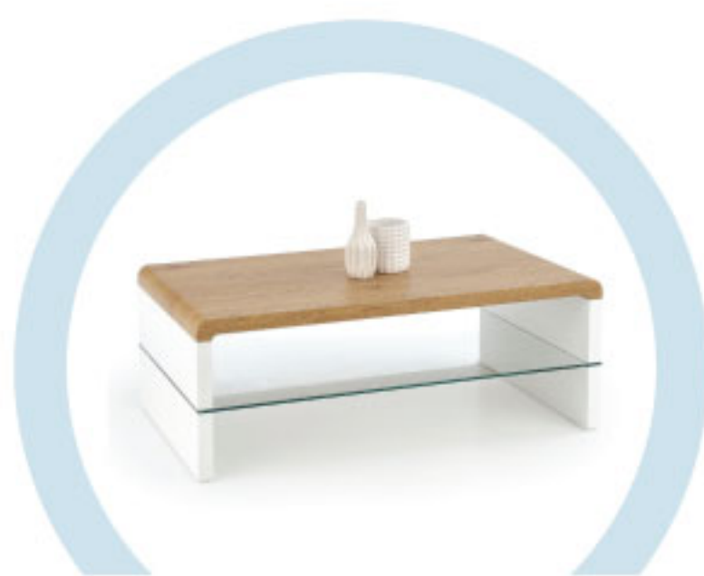
ЖУРНАЛЬНЫЕ СТОЛИКИ И ПРОЧИЕ ЖЕСТКИЕ ПОВЕРХНОСТИ